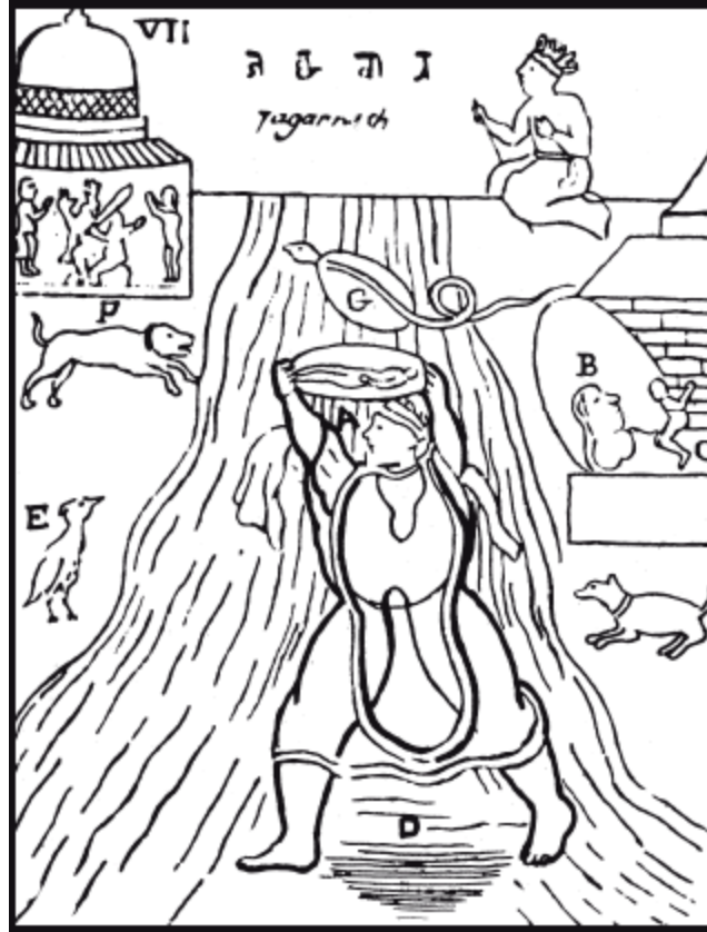
9-я карта Индийского Таро