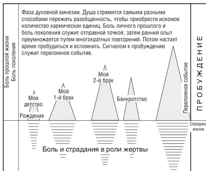
Рис. 1. Путешествие души (1)

Если вы задаетесь вопросом, на каком этапе путешествия находится ваша душа, то, по моему мнению, независимо от вашего возраста, вам не стоит читать эту книгу до того, как вы прошли точку пробуждения. В этом случае вам уже давно следовало ее отложить. Читателю нужно набрать еще много кармических единиц, прежде чем ему откроется смысл изложенной идеи.